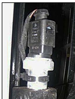
冷媒圧力センサー