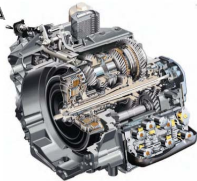
6速Sトロニック型自動変速機