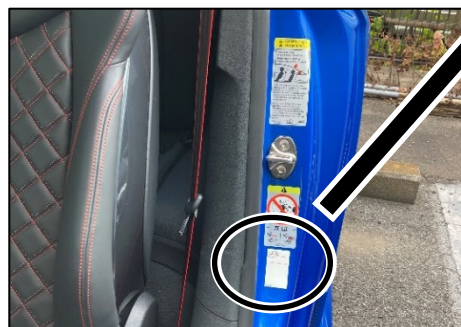
左ドアストライカの下