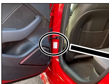
車体側の左リヤドアヒンジの下

識別： 4ドア車は車体側の左リヤドアヒンジの下に、2ドア車は左ドアストライカの下に、「42L5」と記入したキャンペーンステッカーが貼付してあります。