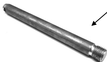
ホイール交換用ピン